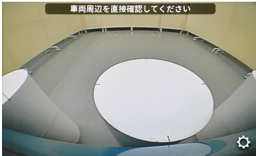
近接視界 Proximity field of vision