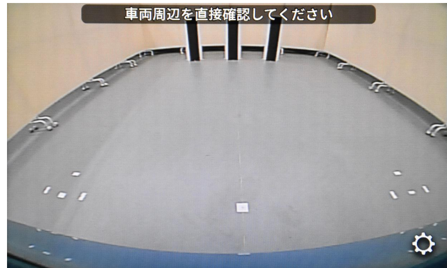
遠方視界 Distant field of vision