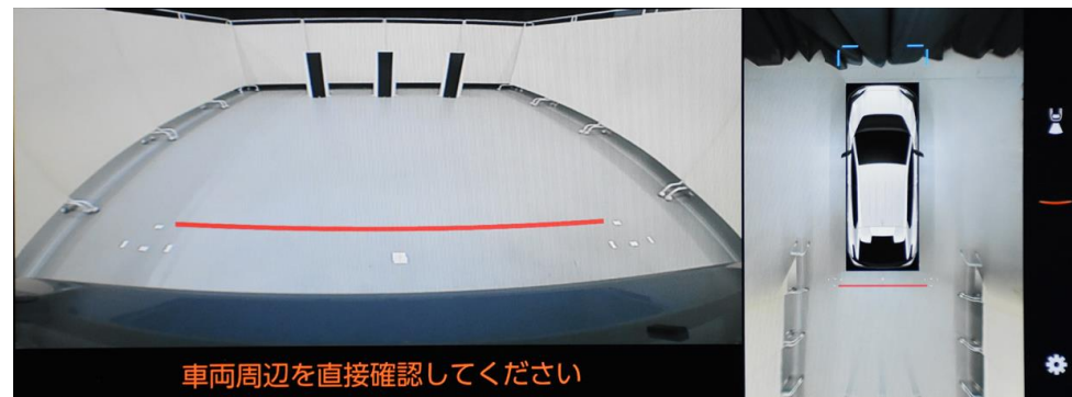
遠方視界 Distant field of vision