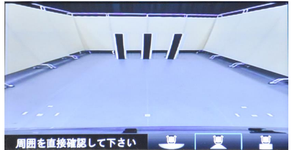
遠方視界 Distant field of vision