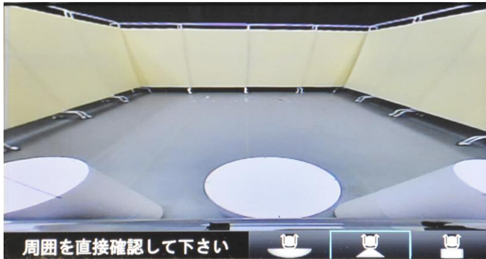
近接視界 Proximity field of vision