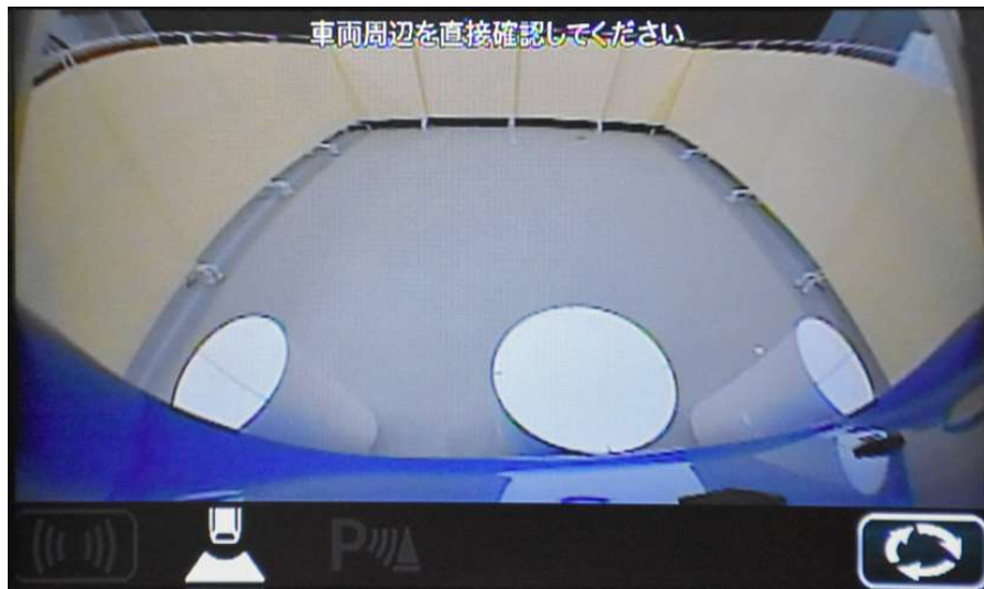
近接視界 Proximity field of vision