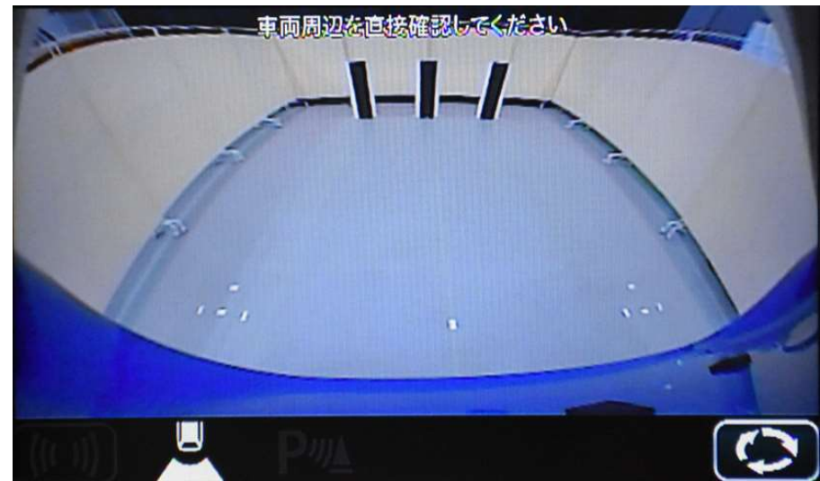
遠方視界 Distant field of vision