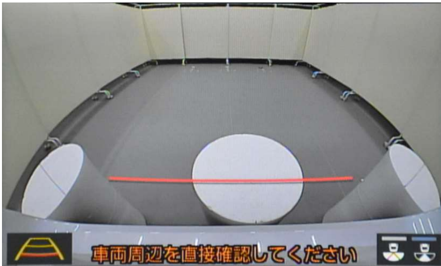
近接視界 Proximity field of vision