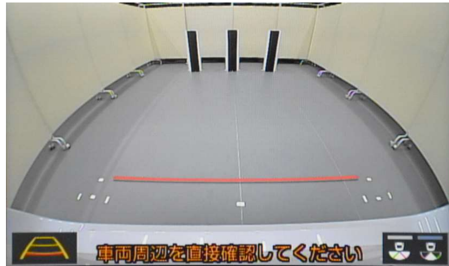
遠方視界 Distant field of vision