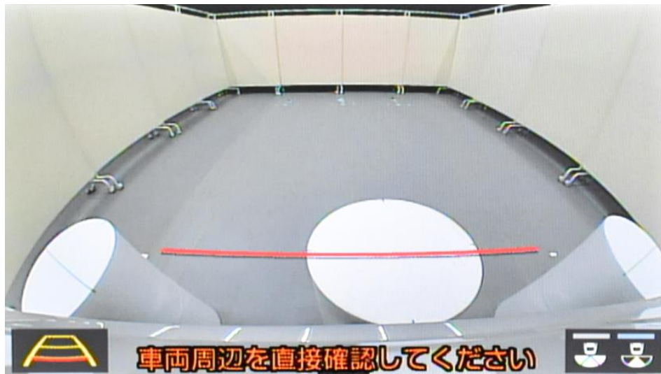
近接視界 Proximity field of vision