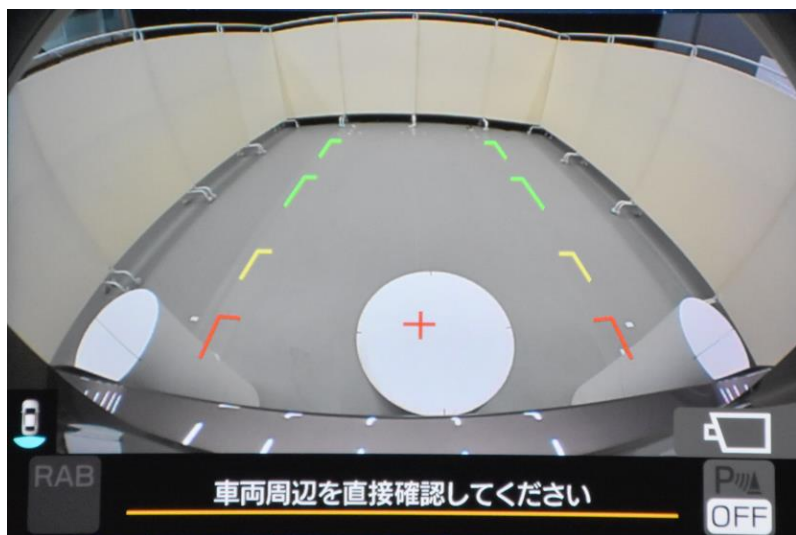
近接視界 Proximity field of vision