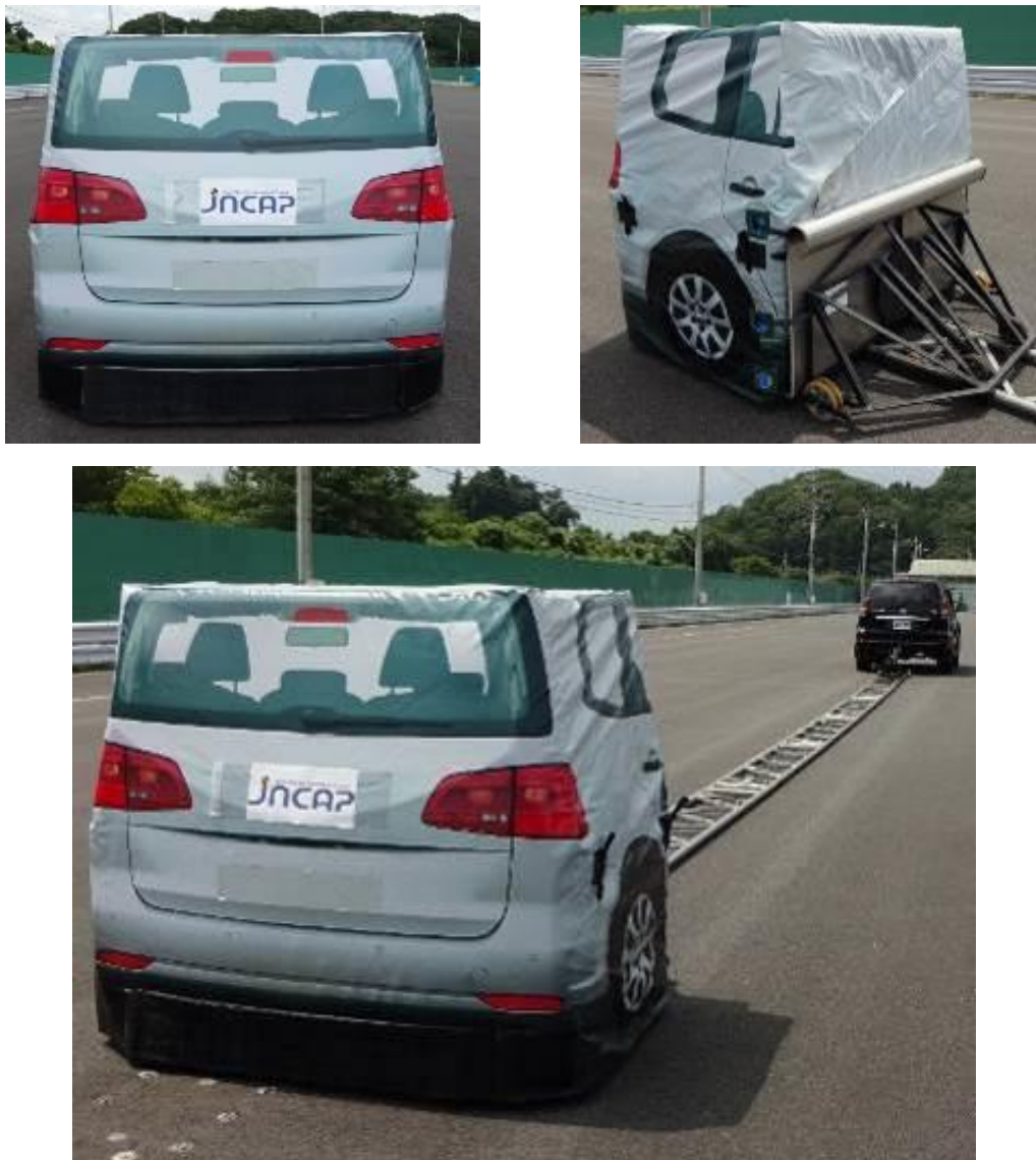
付図 1 試験用ターゲットの外観

試験車両のナンバープレート部には「JNCAP」の布製ロゴシールを貼る。試験用ターゲットの空気圧は 25kPa に設定し、試験中はこの空気圧を維持すること。