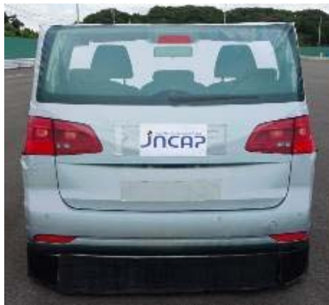
付図 1 試験用ターゲットの外観

試験自動車のナンバープレート部には「JNCAP」のロゴシールを貼る。試験用ターゲットの空気圧は 25kPa に設定し、試験中はこの空気圧を維持すること。