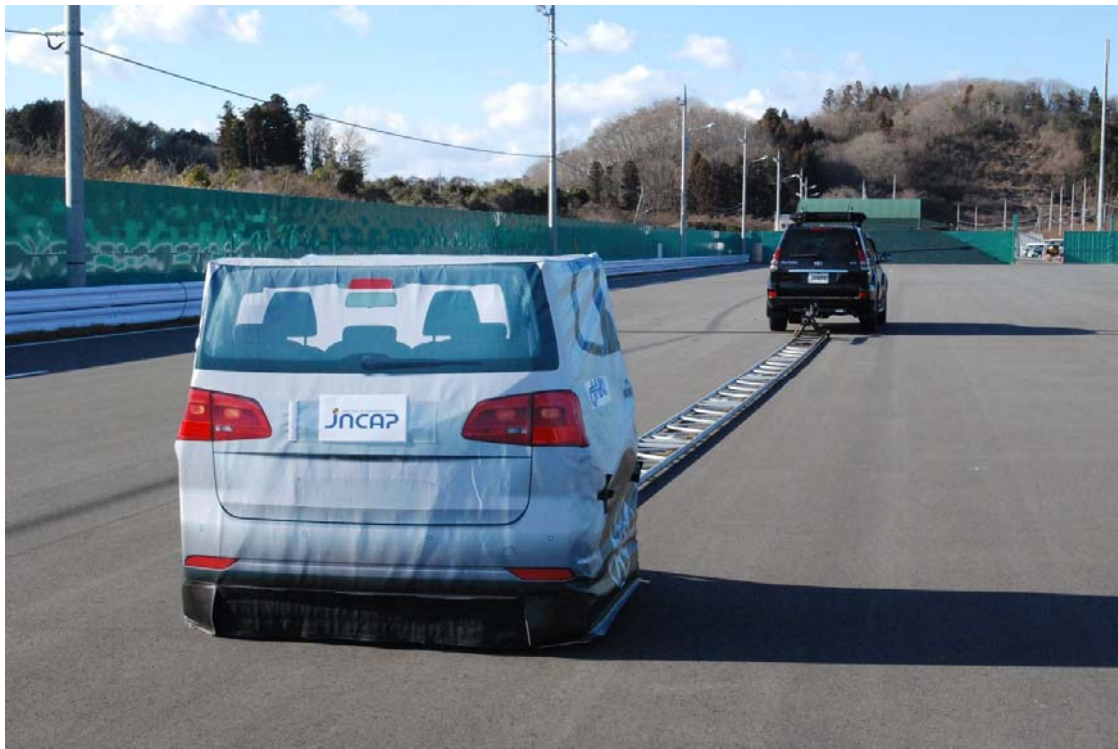
付図 1 試験用ターゲットの外観