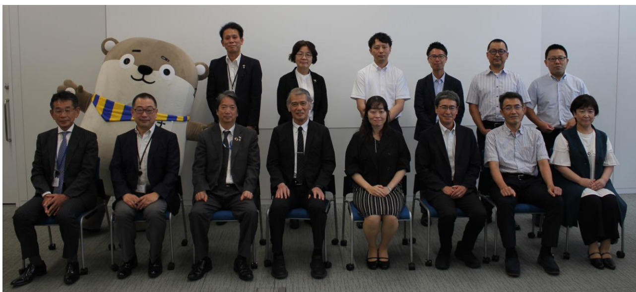
(参画病院の皆様とナスバー同、ナスバマスコットキャラ ナスバちゃん)