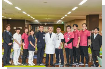
社会医療法人 聖の聖母会 聖マリアヘルスケアセンター