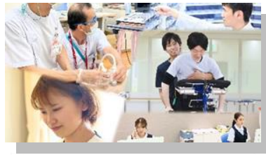
社会医療法人 愛仁会 AINIKAI REHABILITATION HOSPITAL 愛仁会リハビリテーション病院