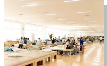
Kanagawa Rehabilitation Hospital 神奈川県リハビリテーション病院