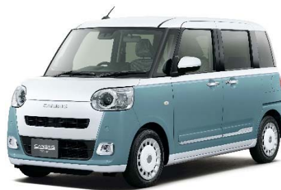
ダイハツ 「ムーヴ キャンバス」

ダイハツ「ムーヴ キャンバス」については、総合評価として★★★★☆（4星）の評価となりました。