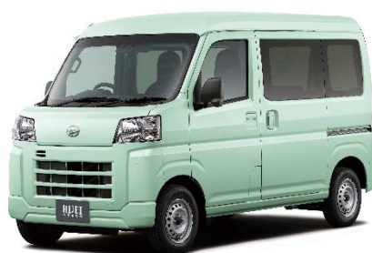
写真は、ダイハツ「ハイゼット カーゴ」

ダイハツ「ハイゼット カーゴ/アトレー」、スバル「サンバー バン」、トヨタ「ピクシス バン」については、総合評価として★★★★☆（4星）の評価となりました。