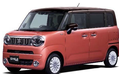
スズキ ワゴンRスマイル

スズキ「ワゴンRスマイル」については、総合評価として★★★★☆（4星）の評価となりました。