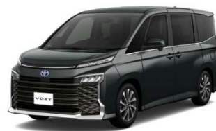
トヨタ ヴォクシー