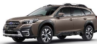
スバル レガシィ アウトバック