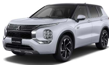
三菱 アウトランダーPHEV