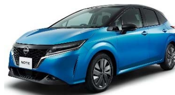
日産・ノート / ノート オーラ