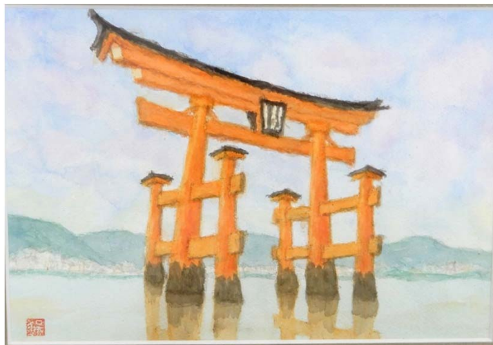
重い障がいを負った方が口に筆をくわえて描いた作品 「安芸の宮島 大鳥居」

作品を通じて被害者の現況を知り、交通事故について今一度考えていただけることを願っています。