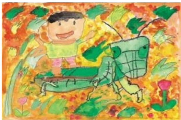
交通遺児友の会絵画コンテスト最優秀賞(国土交通大臣賞) 「カマキリとぼく」