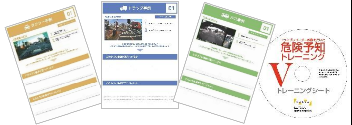
(トレーニングシートはCDから印刷します)