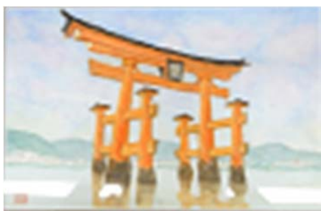
「安芸の宮島 大鳥居」