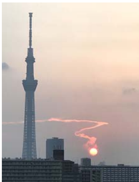
平成29年度交通遺児友の会写真コンテスト 最優秀賞(国土交通大臣賞)

この「ナスバギャラリー IN 東京」は、交通遺児等のコンテスト入賞の写真作品や重度後遺障害者の方々による創作作品等の展示を通して、自動車事故被害者の現況を知って頂き、同様の被害者を発生させてはならないという事故防止の意識の醸成を図るとともに、ナスバが行う被害者援護業務のPRと自賠責保険の確実な加入を促すための広報・啓発活動を併せて行うこととしています。是非お立ち寄り、ご高覧下さい。