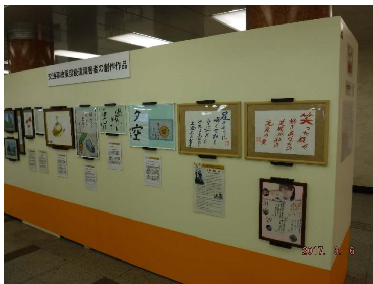
昨年の「ナスバギャラリーIN 東京」 重度後遺障害者の創作作品展示の様子