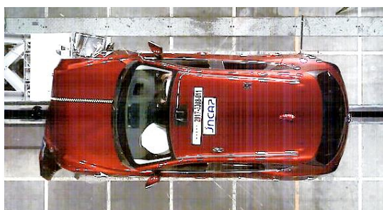
衝突安全性能評価試験の様子