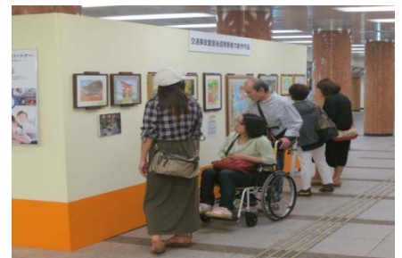
昨年の「ナスバギャラリー IN 東京」の様子