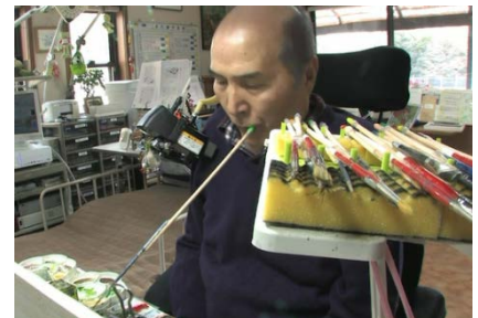
重度後遺障害者の作品創作の様子