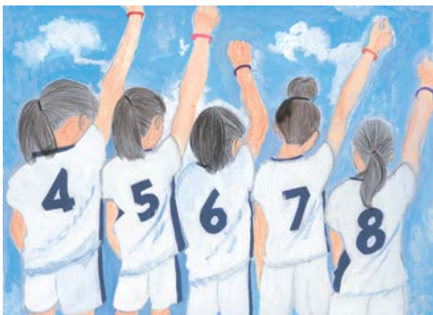
27年度交通遺児友の会絵画コンテスト 最優秀賞(国土交通大臣賞)

この「ナスバギャラリー IN 東京」は、交通遺児等のコンテスト入賞の絵画作品や重度後遺障害者の方々による創作作品等の展示を通して、自動車事故被害者の現況を知って頂き、同様の被害者を発生させてはならないという事故防止の意識の醸成を図るとともに、ナスバが行う被害者援護業務のPRと自賠責保険の確実な加入を促すための広報・啓発活動を併せて行うこととしています。是非お立ち寄り、ご高覧下さい。