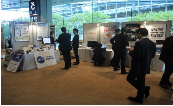
支援ツール機器メーカー等による展示・紹介

また、安全マネジメント支援ツール（デジタル式運行記録計、映像記録型ドライブレコーダー、アルコール検知器、SAS(睡眠時無呼吸症候群)スクリーニング検査機器等)の展示・紹介を行いました。