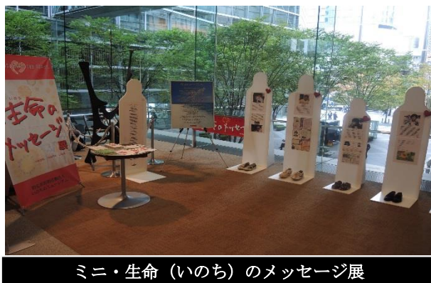
ミニ・生命（いのち）のメッセージ展

ロビーでは、安全対策に取り組まれている事業者様に一層の安全意識を高めていただくため、交通事故被害者等の生命の重みを伝える「ミニ・生命（いのち）のメッセージ展」を開催しました。