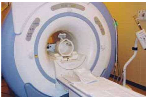
磁気共鳴コンピューター断層撮影装置 (MRI)