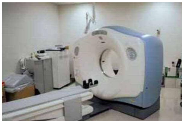
X線コンピューター断層撮影装置 (CT)