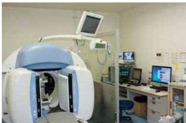
核医学画像診断装置 (RI)